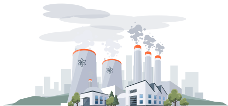
FOSILNI IZVORI ENERGIJE