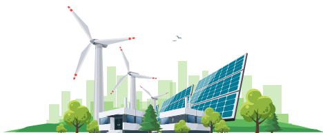
ENERGIJA IZ OBNOVLJIVIH IZVORA